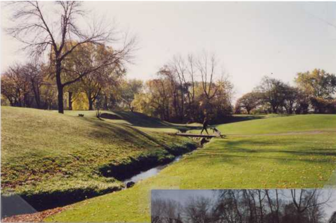
le Petit St. Pierre aujourd'hui