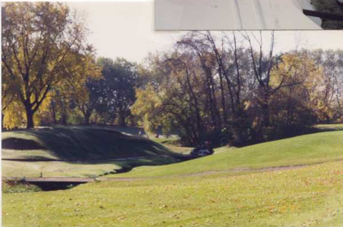
entre Côte St. Luc et Lachine